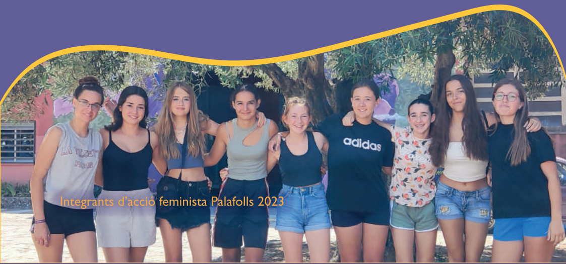
Integrants d’acció feminista Palafolls 2023

Palafolls compta durant tot l’any amb el grup d’Acció Feminista que treballa dia a dia per aconseguir un municipi lliure de violències cap a les dones i els col·lectius oprimits.